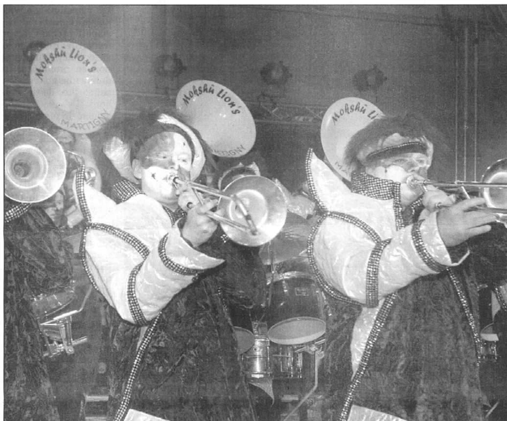
La guggenmusik Mokshû Lion's est la seule formation européenne invitée au carnaval de la Martinique.

Demain, samedi 10 février, 34 musiciennes, musiciens et accompagnants des Mokshû Lion's s'envoleront donc pour La Martinique. Ils y séjourneront jusqu'au 21 février avec un programme pour le moins chargé: «Dimanche, nous prendrons déjà part à la Parade du Nord organisée par le Baryl Band. Cette parade attire 30 000 personnes. Durant la semaine, nous participerons à des animations locales dans les villages et nous serons reçus par les autorités départementales. Puis, dimanche 18, lundi 19 et mardi 20, ce seront les grandes parades de carnaval à Fort-